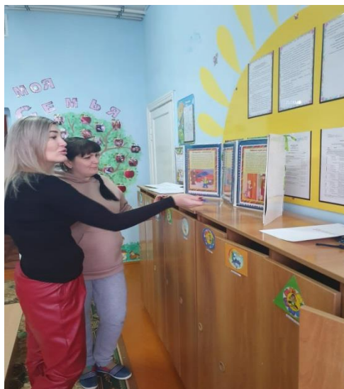
Квест-игра «Природа и мы!»