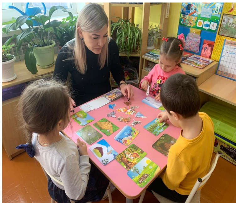
Подбор детской художественной литературы о природе